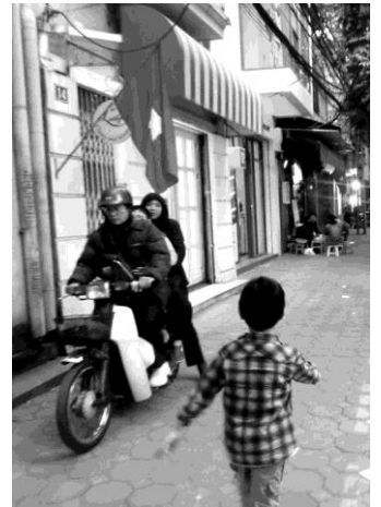
ベトナムの首都ハノイを散歩