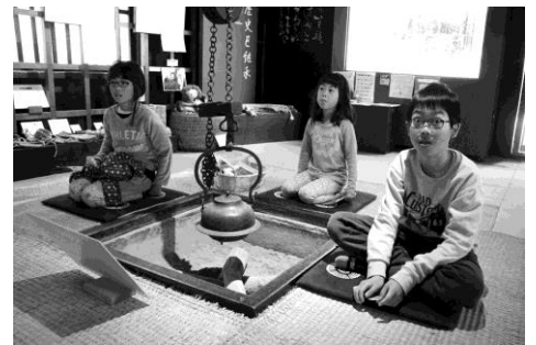
五箇山の民俗館にて